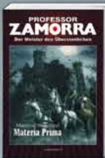
Professor Zamorra 47 Materia Prima