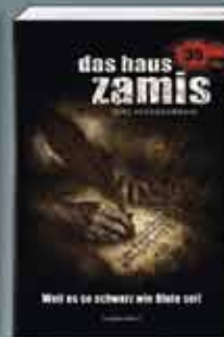
Das Haus Zamis 35 Weil es so schwarz wie Blute sei