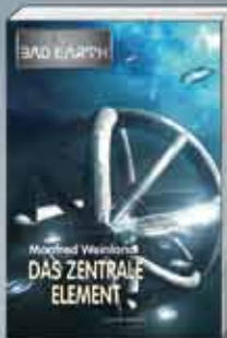
Bad Earth 35 Das Zentrale Element