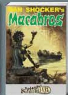
Dan Shocker's Macabros 12 Kaphoons blutige Tränen