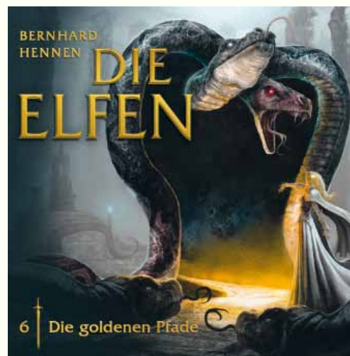
Fantasy für die Ohren: Die zweite Staffel von Bernhard Hennens DIE ELFEN ist Ende Mai gestartet